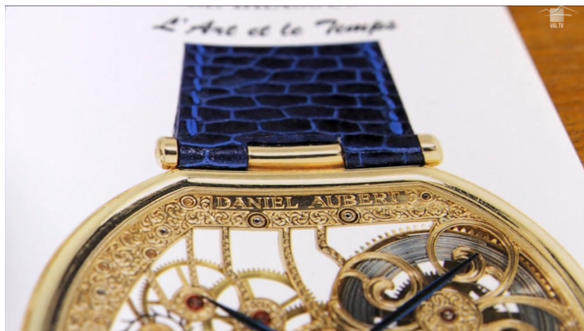
Montre Daniel Aubert marque déposée