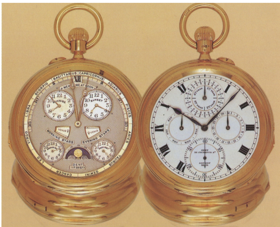
L'Astronomique Dent No 32573 double face

du coucher du soleil et de la lune, plus d'autres complications. Cette montre a été revendue aux enchères par Habsburg et Feldman Antiquorum en 1889 pour CHF 1'540'000.— Montre la plus compliquée du Monde de son époque.