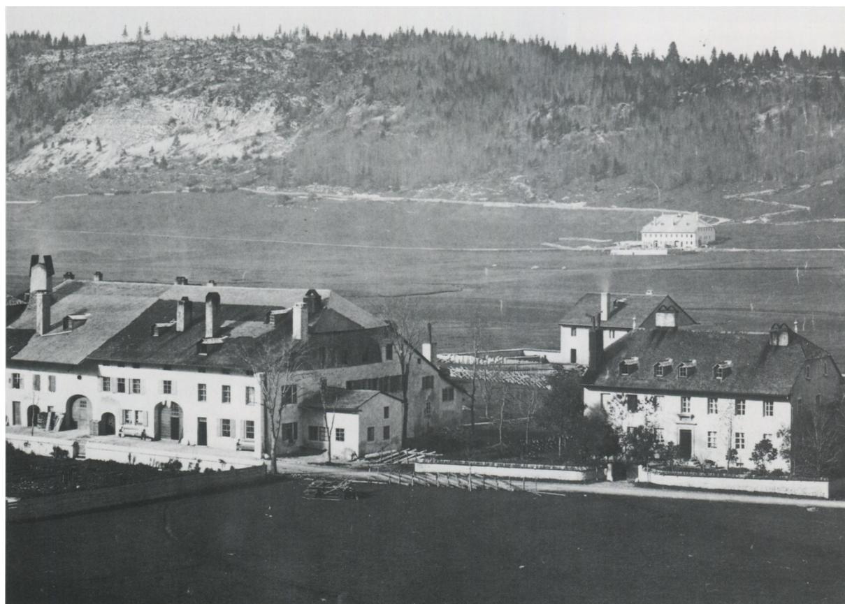
Le grand voisinage du bas du village du Brassus au XIXème siècle avec en annexe le petit atelier de Léon Aubert.

Léon Ernest sera prédicateur pour l'assemblée évangélique, prêchant dans "la chambre haute" logée dans le même grand voisinage.