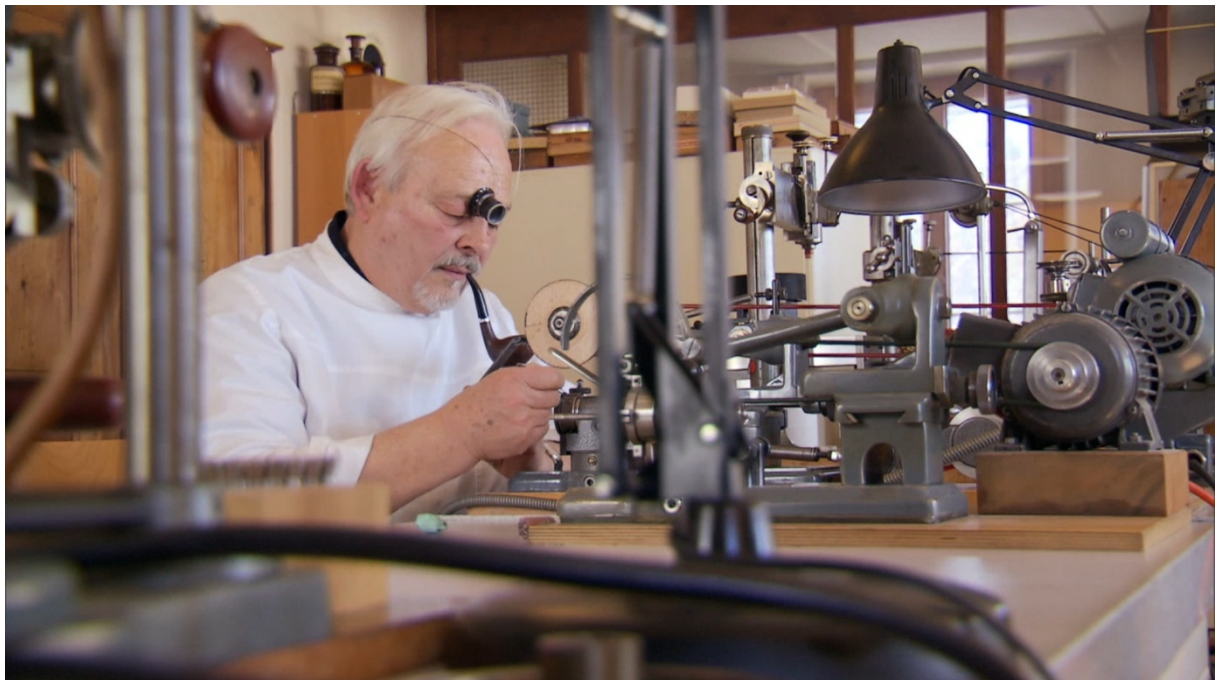
Polissage des ailes d'un pignon à la meule bois