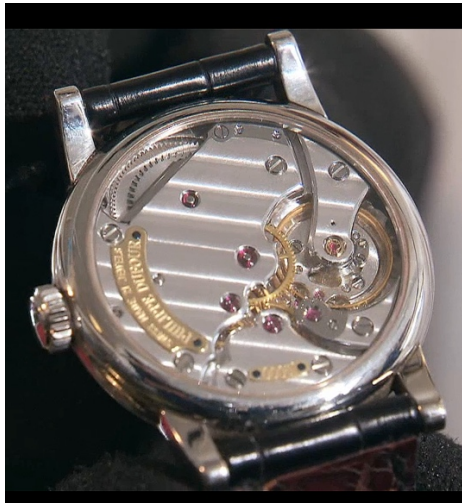
montre Simplicity vue côté ponts.

Des créations pour lesquelles il faut savoir patienter longtemps, quelquefois plusieurs années, pour les acquérir, tant son carnet de commandes déborde. Quant à une future création, il n'en dit rien, elle devrait être présentée d'ici à un an, peut-être deux.