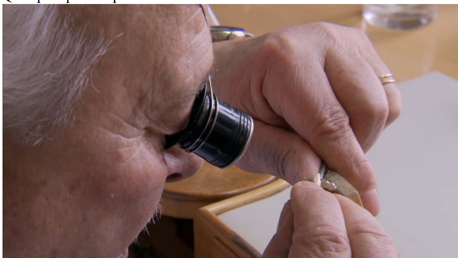
Polissage angle à la buchette

Quelques photos prises dans son atelier: