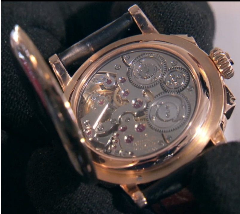
montre Grande sonnerie

En 1992 il achève une grande sonnerie à répétition minute de 480 pièces, une première mondiale en montre bracelet. Elle ne sera produite qu'à 6 exemplaires. La même année, il intègre l'Académie des horlogers et créateurs indépendants.