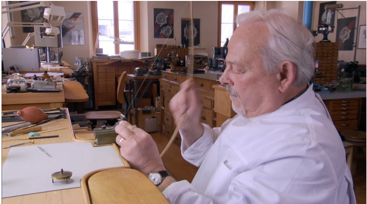
Polissage contre-fraisage trou à l'archet